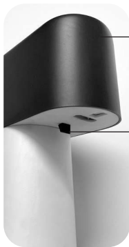
Release lever for funnel